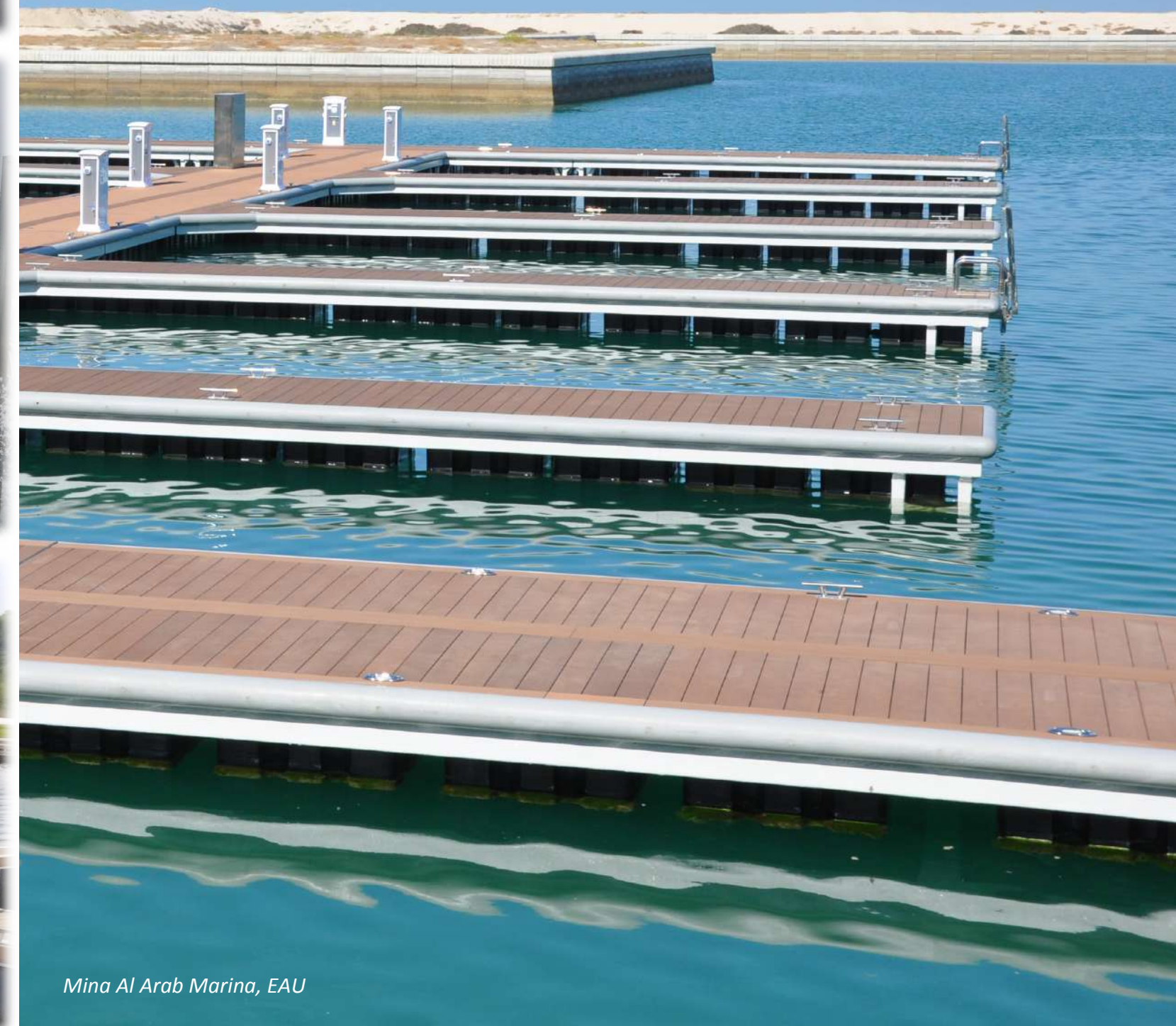
Mina Al Arab Marina, EAU