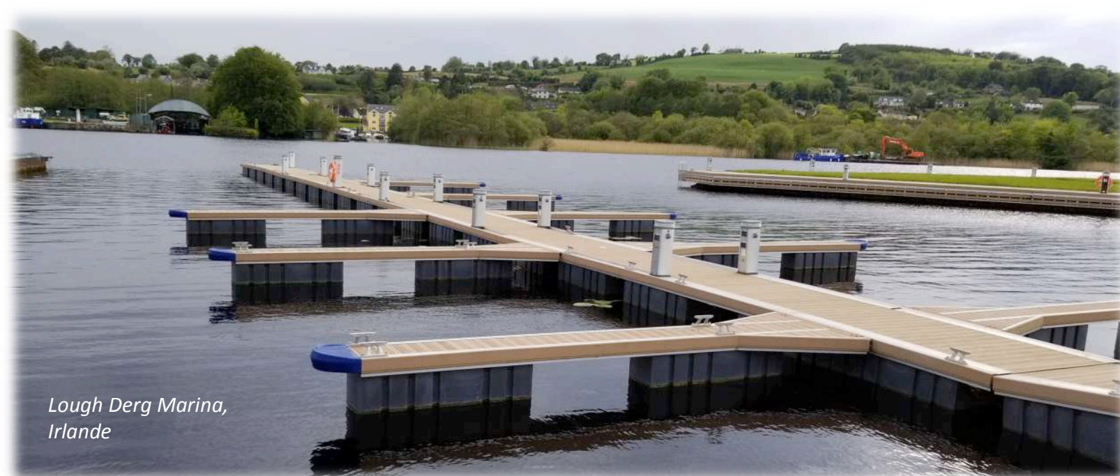
Lough Derg Marina, Irlande