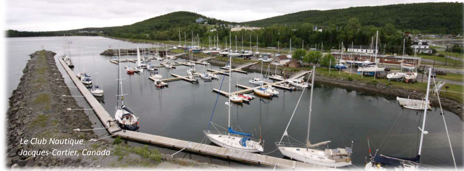
Le Club Nautique Jacques-Cartier, Canada